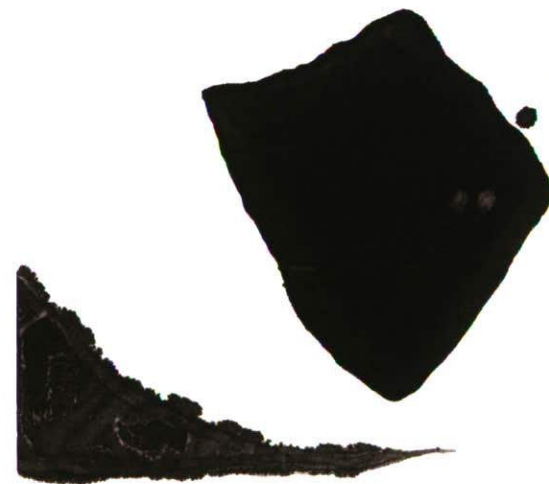
bedrohung - ewigkeit

Gehen, es dringt ins Verstehen vor und zurück, auf dem Rücken der Landschaft trägt die Erinnerung einen Gesang vor wie Stille, die nur mit dem Wind spricht und jetzt wieder aufbricht, weil die Schritte sie nicht verschweigen.