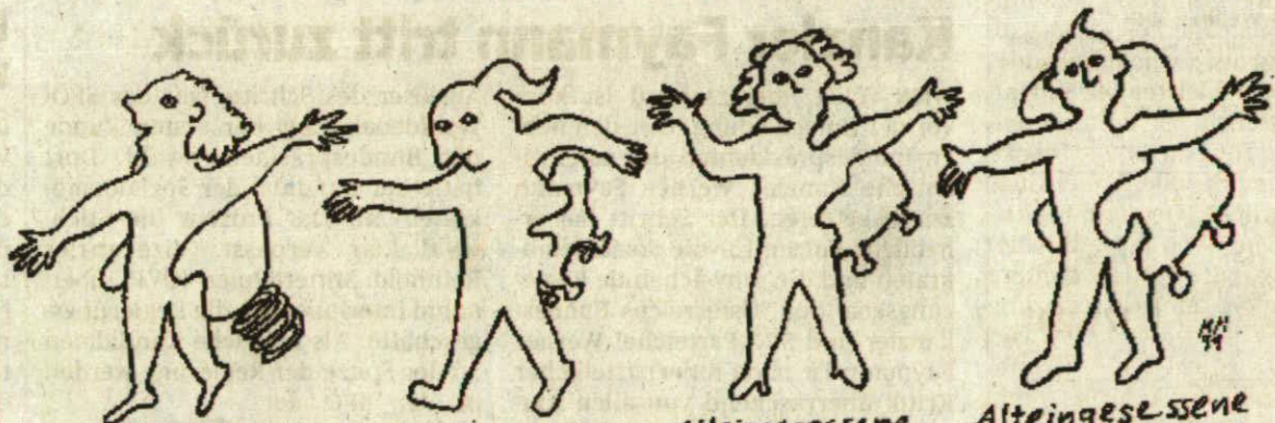
Alteingesessene Staatenlose Alteingesessene 1. generation Alteingesessene 2. generation Alteingesessene 3. generation

Im Jahr 1999 veröffentlichte das Volksblatt eine Comicserie der Aktion miteinander, die sich mit den Einheimischen in Liechtenstein beschäftigt. Der erste Comic (10. Mai) um-