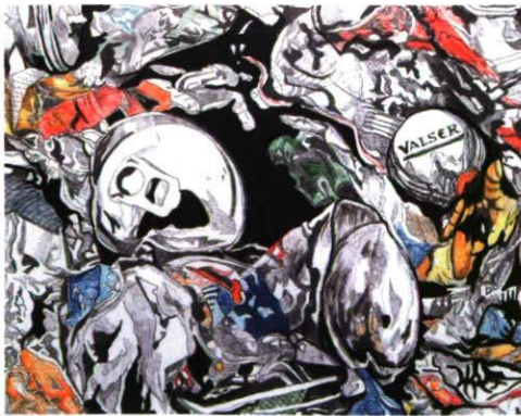
Perfect Recycling 1 Acryl 50 x 40