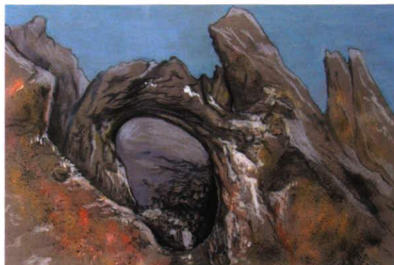
Felsenloch Acryl 50 x 70 Im Liechtensteiner Alpenmassiv

Titelseite: Schlucher Acryl 55 x 70 Sonnenuntergang im Malbuner Berggebiet