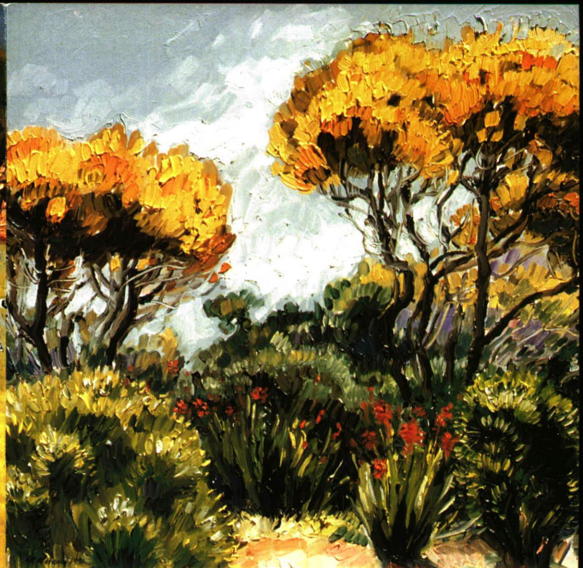
LAGUNA BEACH OIL 1991