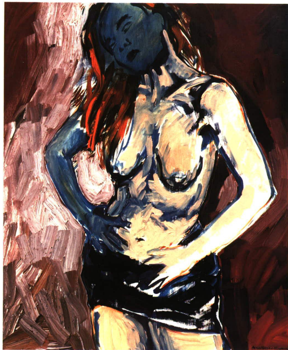
ALASTON • NUDE • AKT OIL 1990