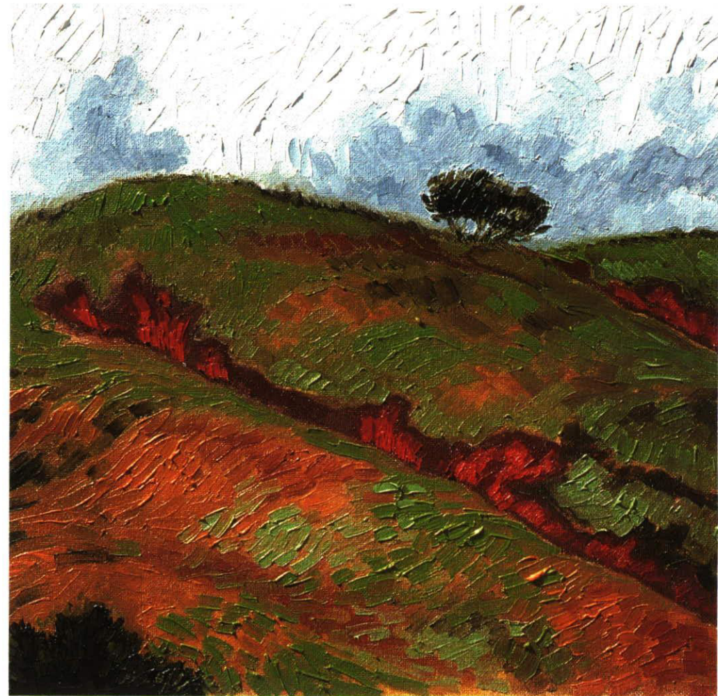
HAIJENNUT MAA • WHEN THE EARTH MOVED • ALS DIE ERDE ZERBARST OIL 1991