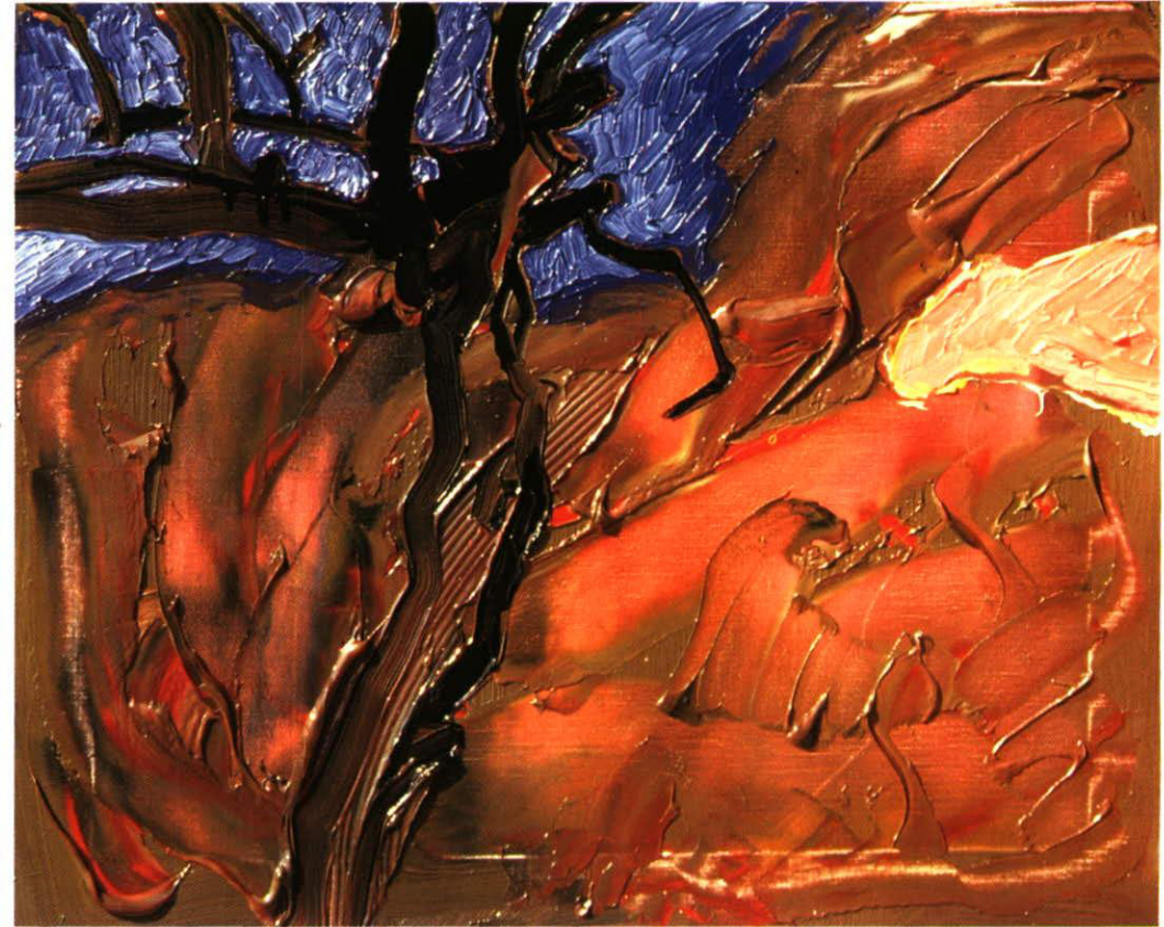
KUUTAMO • MOONLIGHT • MONDSCHEN OIL 1991