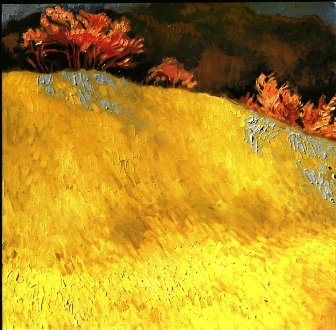
KELTAINEN PELTO • YELLOW FIELD • GELBES FELD OIL 1991