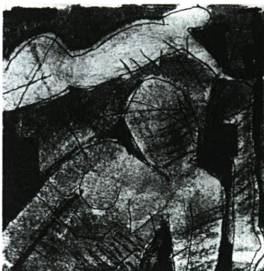
LEBEGŐ FIGURA (textilkollázsok, selyem) FLOATING FIGURE (textile collages, silk)