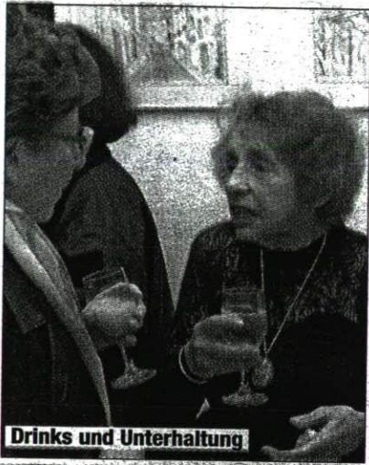
Drinks und Unterhaltung