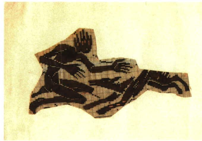
Zeichnung mit Mensch und Hund, undatiert, FNS, Archiv-Atelier, Vaduz

Die Ausstellung ist eine Produktion des Kunstmuseum Liechtenstein, kuratiert von Christiane Meyer-Stoll in Kooperation mit Eva Frommelt-Mengou Tata, Prof. Ferdinand Nigg-Stiftung.