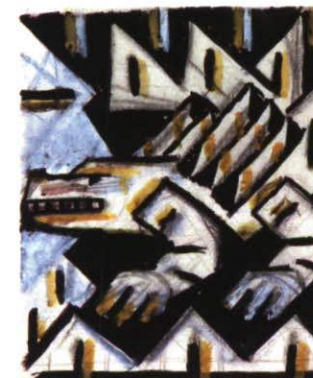
Der Georgs-Drache, undatiert Kunstmuseum Liechtenstein, Vaduz