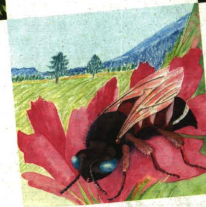
Philatelie Liechtenstein. Briefmarkenausgabe 2008. Seltene Bienen und Wespen in Liechtenstein. Schmuckbiene