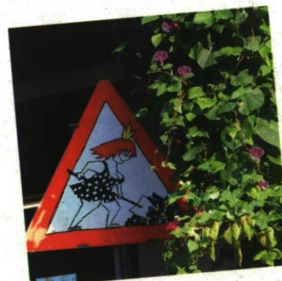
Stabsstelle für Chancengleichheit 2009. 25 Jahre Frauenstimmrecht in Liechtenstein