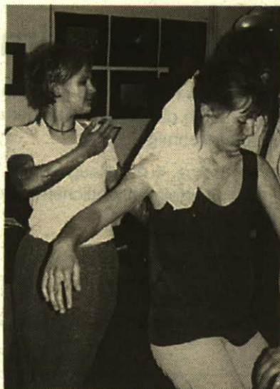
Performance von Schülern des Gymnasiums Vaduz

Vernissage der Fotoausstellung von Ursula H. S. Kühne