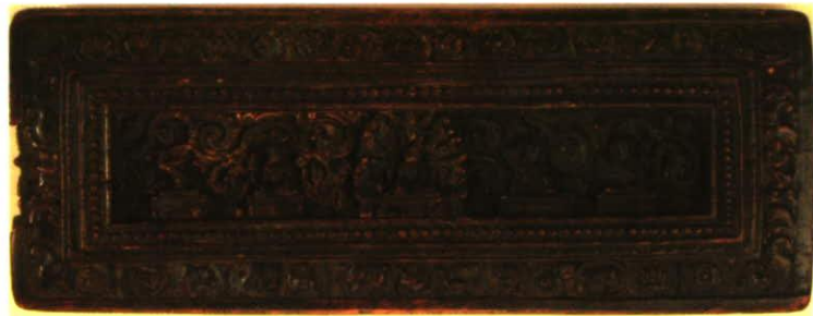
Tibetischer Buchdeckel aus der Tibetica-Sammlung des Landes FL