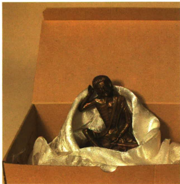
Milarepa in der «Schachtel-Eremiten»