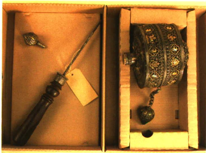
Tibetische Gebetsmühle, in ihre Einzelteile zerlegt...