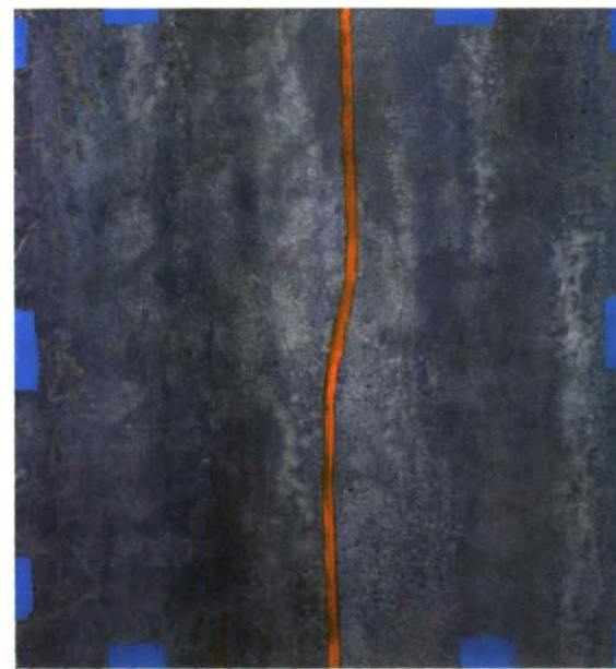
2003, 130x120cm, Acryl auf Leinwand