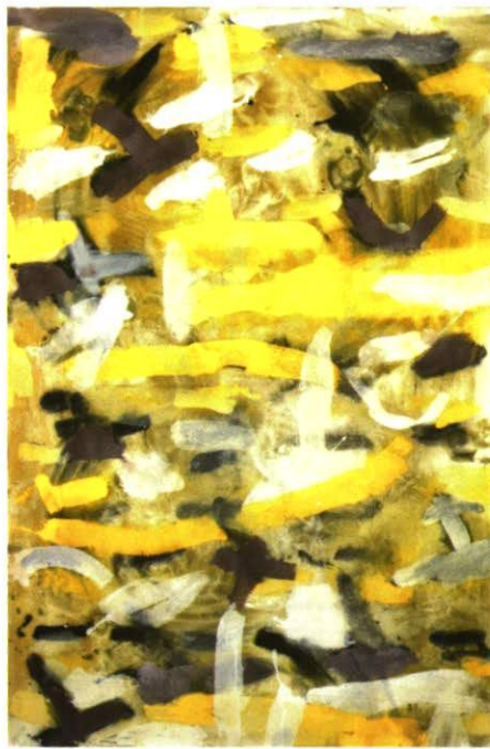
1998, 180x120cm, Acryl auf Leinwand

Seit 1970 freischaffend als bildende Künstlerin, Schriftstellerin und Publizistin tätig. Ateliers in Liechtenstein und Tessin. Ihr bildnerisches Schaffen umfasst Malerei, Druckgraphik, Zeichnungen, Fotografie und Plastiken. Zahlreiche Ausstellungen in Galerien und Museen in der Schweiz, in Liechtenstein, Deutschland, Italien und Österreich. Trägerin verschiedener Kulturpreise, darunter auch diejenigen der Städte Graz und Konstanz.