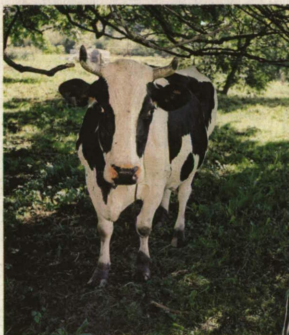
In Ruggell wird am Freitag «Kuhwelten» vom Fotografen Erich Allgäuer eröffnet.