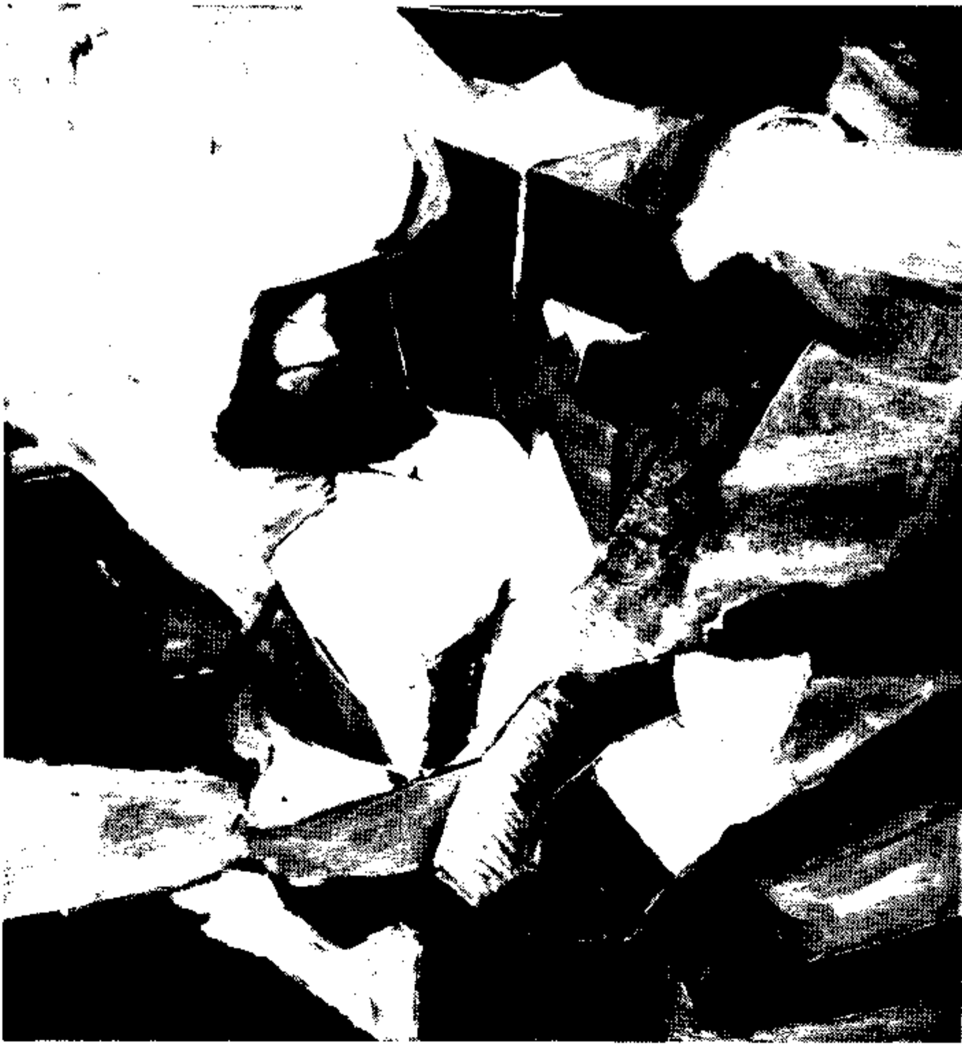
«Wandlung». Acryl auf Leinwand, H 100 cm, B 120 cm