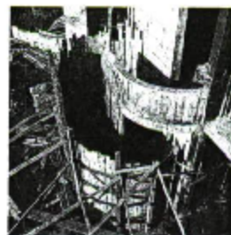
Centrum für Kunst und Kommunikation in Bau, Vaduz um 1973