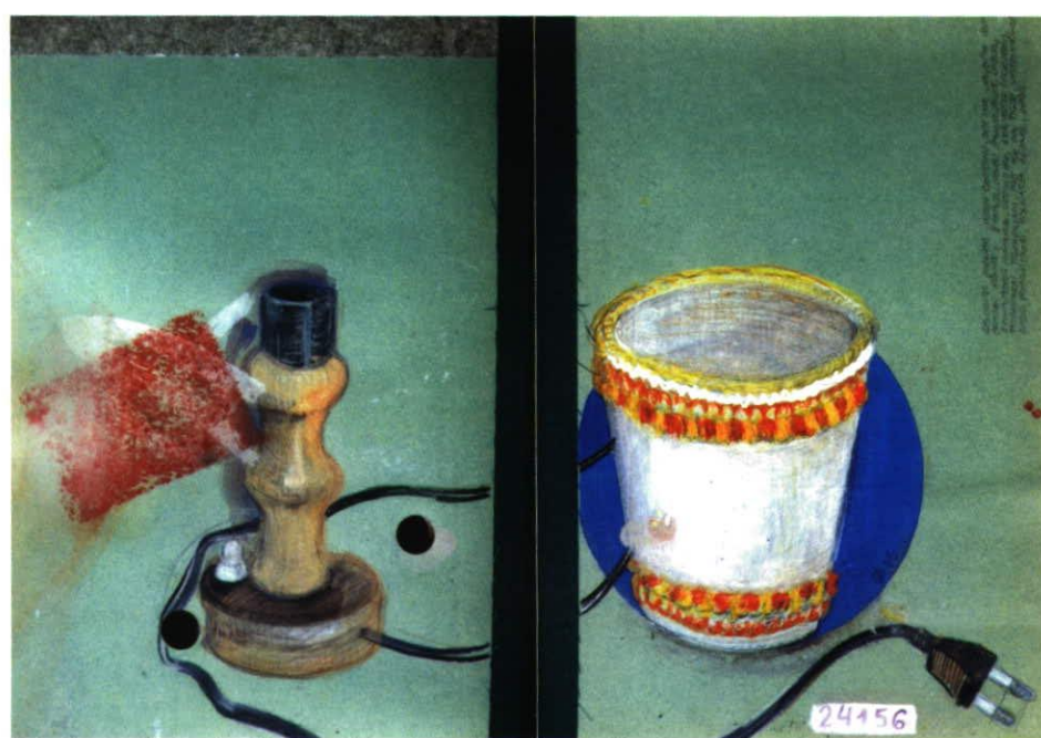
„Verbraucher“, aus dem SilvettaBilderbuch, 48 x 33 cm, Wasserfarbe und Buntstift auf Karton