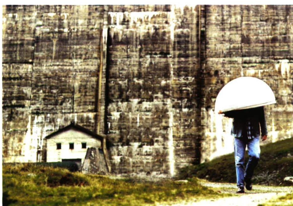
„Postkartentagebuch Silvretta“, digital bearbeitete Fotografie