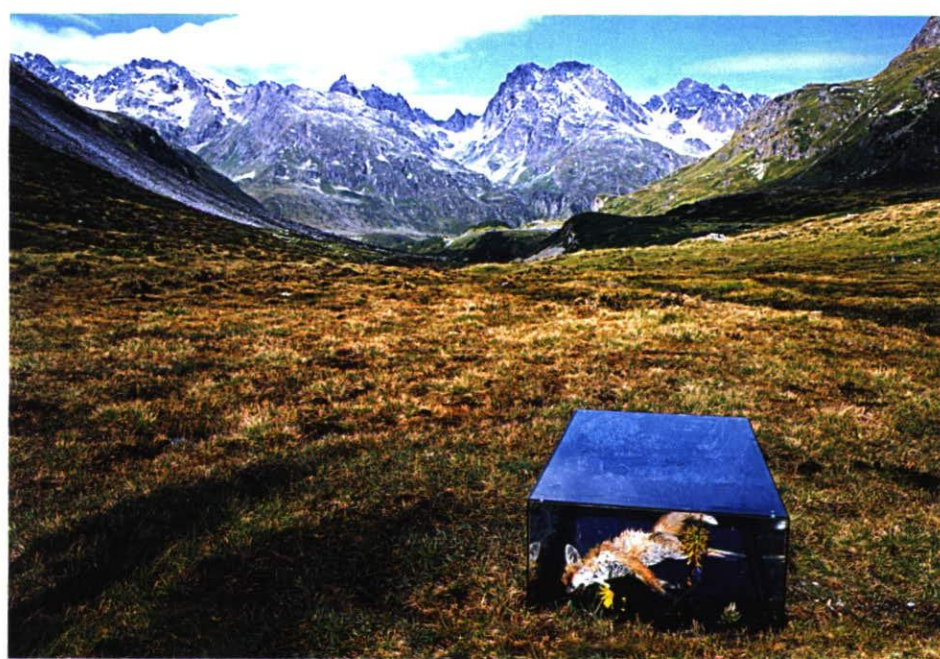
„Mon petit Jardin“