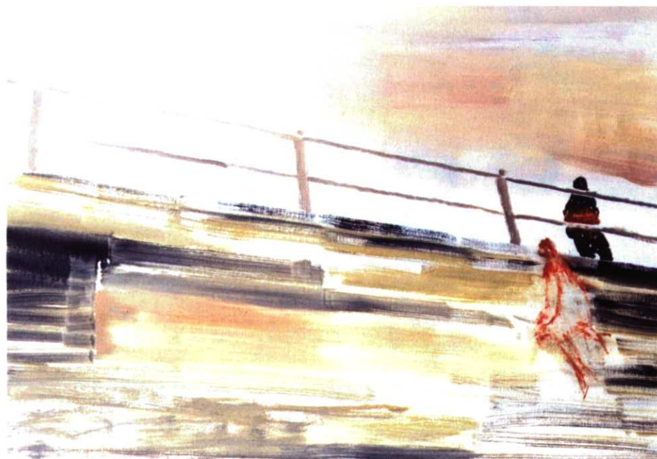
„J'oreal“, 60 x 80 cm, Öl/Leinwand