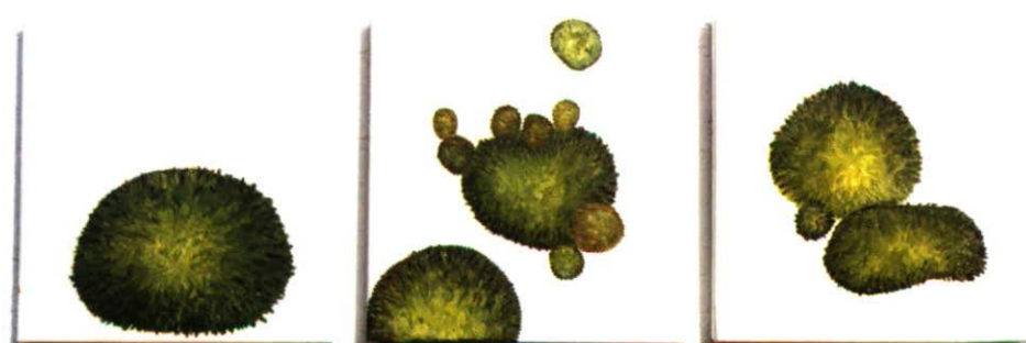
„Moospolster“ (Ausschnitt), 24-teilig à 30x30 cm, Öl/Leinwand

am Donnerstag, den 26. April 2001 20.00 Uhr im Palais Liechtenstein Feldkirch