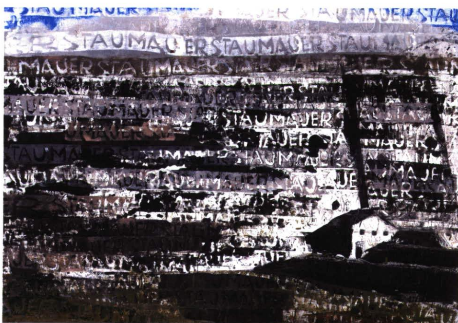
„Staumauer“, 60 x 65 cm, Acryl/Papier