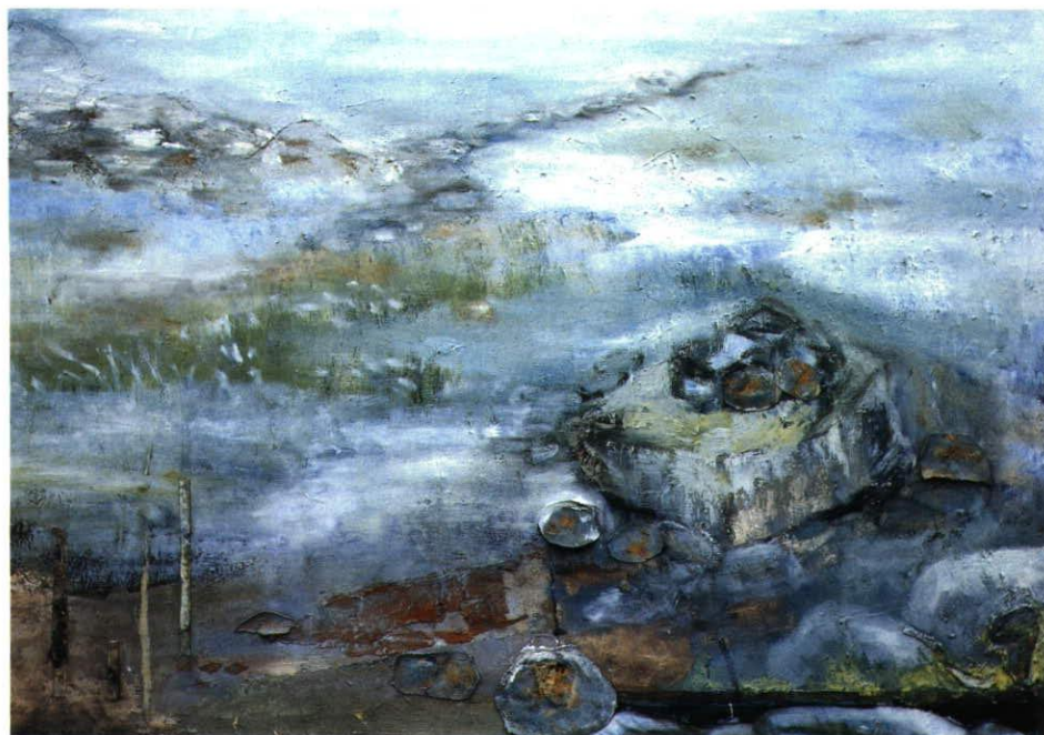
„Steinfeld“, 100 x 150 cm, Öl/Leinwand