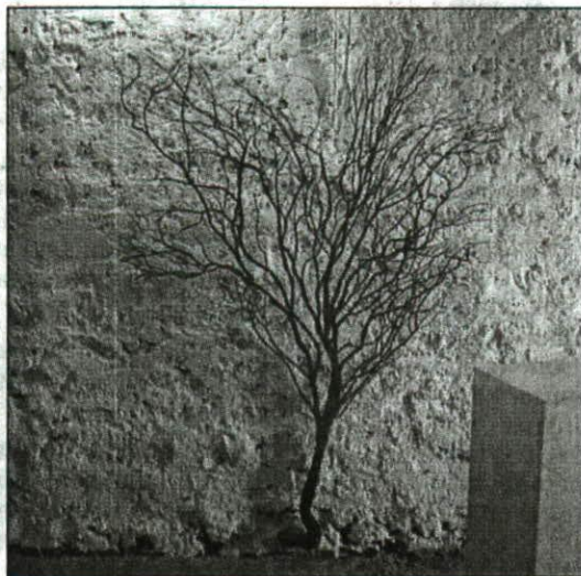
Des interventions autour du paysage si particulier de Roquebrun.

devant", s'inscrivant dans la continuité.