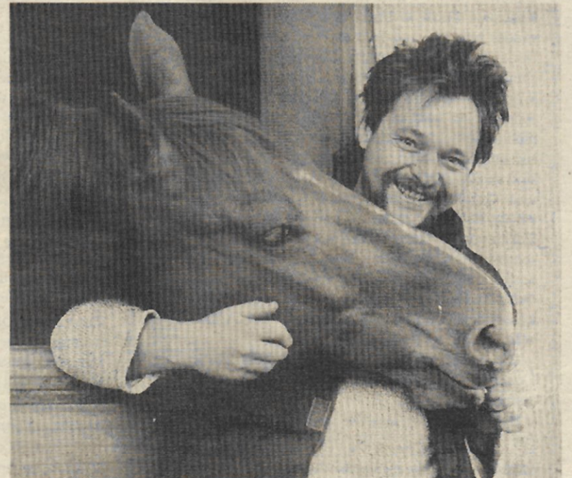
Ein grosse Leidenschaft des Bildhauers ist das Reiten.