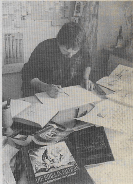
Eine besondere Schwäche hegt der Steinmetz für geometrische Konstruktionen.