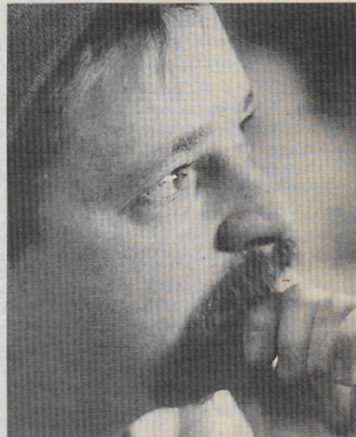
«Wenn man eine Woche gekämpft und durchgebissen hat, und das Werk fertig ist, empfinde ich riesiges Glück», beschreibt der Bildhauer den schönsten Moment in seinem Beruf.