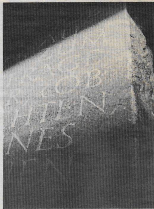
Eckhard Wollwage: «Grabsteine erarbeite ich mit und für Menschen.»