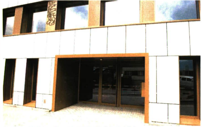
Eingangsbereich: Das neue Bürohaus steht direkt an der Zollstrasse in Vaduz.