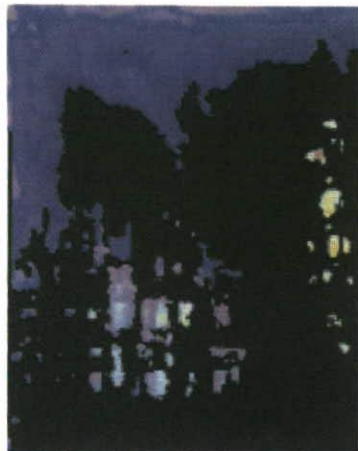
HOP D-Code 1

Galerie Artestade Aeulestrasse 45 FL-9490 Vaduz Liechtenstein Telefon +423 237 5284 Telefax +423 237 5285 info@artestade.net www.artestade.net