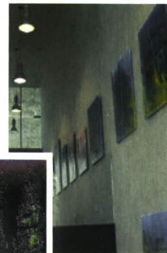
Artestade - Ihre Galere Artestade - your gallery

Artestade Gallery has been opened in November 2000 as a fine arts gallery. Exhibition activities focus on Liechtenstein and international modern and contemporary art. Further to presenting yearly exhibitions from the work of Markus Wanger, gallery Artestade is showing works of international artists and exhibitions in cooperation with international galleries. The spacious gallery rooms, as well as the entire building, are flooded with light.