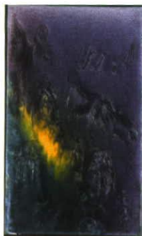
Castle Vaduz 1998