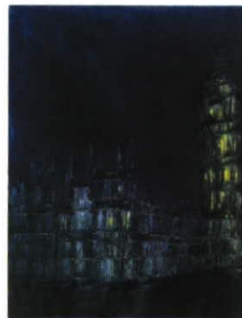
Houses of Parliament