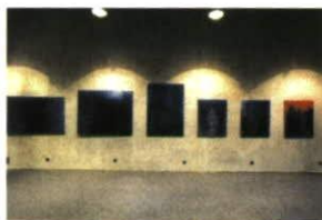
Blick in einen der Galerieräume One of Artestade's gallery rooms

Wanger House is a glass building with clear structures. It appears as a crystalline body and reflects the qualities of rock crystal - precious, shining, mysterious, individual, lasting. Wanger House founds a dialectical contrast to the Art Museum Liechtenstein with a façade made of coloured and smoothly casted concrete of black basalt stone and coloured river gravel, brilliantly reflects the contrasts between light and stone. The double facade has been designed as a climatic shield and buffer zone for energy and sound. It also contains the light installation, designed by Markus Wanger. 544 fluorescent tubes in the colours red, blue, yellow and white can be switched individually, thus creating moods and movement.