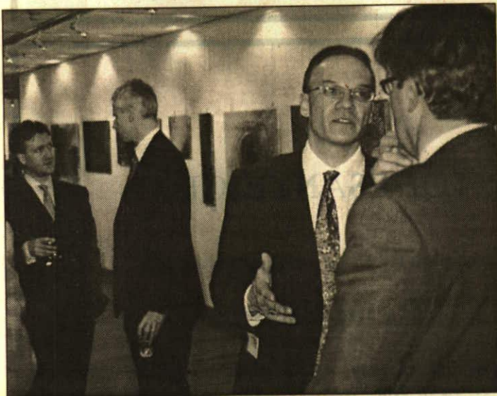
Im Beisein des Künstlers eröffnete der liechtensteinische Botschafter bei der Europäischen Union S. D. Prinz Nikolaus in Brüssel die neue Ausstellung von Markus Wanger.

Rue de Trèves 74 in der belgischen Hauptstadt.