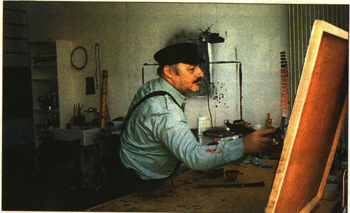
„Wir finden nur das vor, was Menschen hinterlassen oder verlassen haben“, so lassen sich die Bilder des liechtensteinischen Künstlers Werner Marxer interpretieren.

„Eine ganz ungewöhnliche Kulturinitiative, direkt am Geschehen der zeitgenössischen Kunst“, nennt Josef Frommelt aber auch die Aktivitäten des Künstlervereins „Schichtwechsel“ im Alten Bahnhof Schaan.