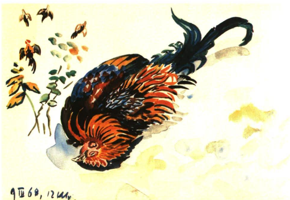
Ein Bankivahahn, die wilde Stammform unseres Haushuhns. Von Prinz Hans am 9.3.1968 erlegt und gemalt in Nepal, Prov. Nasajani

Herbarien der Gefässpflanzen und Farne, der Flechten, Moose und Pilze Liechtensteins umfasst. Die Sammlung der Schnecken und Muscheln unseres Landes, die Tag- und Nachschmetterlinge, die Heu-