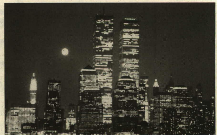
«City by night», ein New-York-Klassiker...

In Liechtenstein fühle ich mich beruflich ziemlich «weg vom Schuss», und da möchte ich bald etwas ändern. Zuerst nun aber die Ausstellung. Sie bildet den wirklichen Abschluss des Werkjahres und bietet dem Publikum die Möglichkeit, in die Entwicklung meiner Arbeit in den USA Einblick zu nehmen und, hoffentlich, viele Fragen zu stellen.