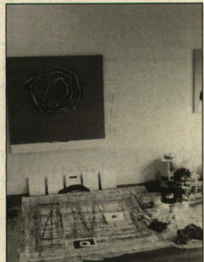
Ein Blick ins Wohn-Studio. An der Wand die Bilder «Lapis invisibilitatis» und «Stella maris», beide auch in Eschen zu sehen.