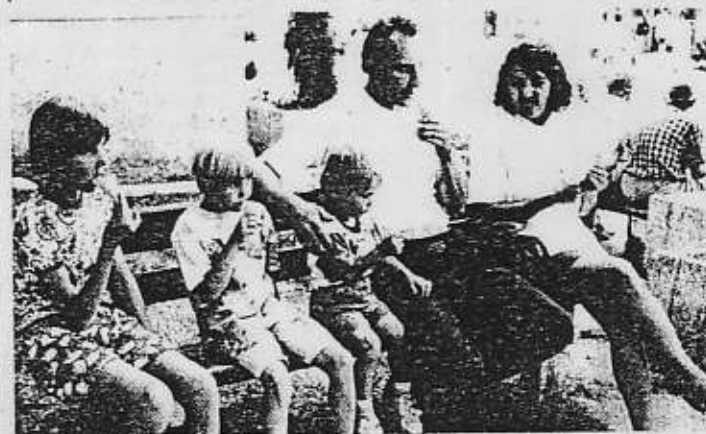
Na lavičkách si radi posedia návštevníci nášho mesta, ktorých ani ku koncu prázdnin, zdá sa, neubúda.

Podľa slov Ing. J. Tušima, podľa svojich možností má Poštová banka záujem o to, aby prispela k rozvoju nášho regiónu a podporila perspektívne projekty. (lum)