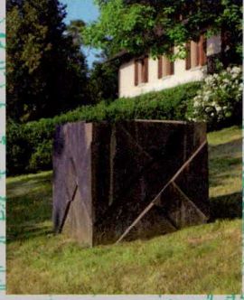
Georg Malin Disentiser-Würfel (auch AndreasKreuz-Würfel ), 1984–86/1988 Bronze, Schenkung der Fürstlichen Regierung