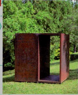
Kurt Sigrist Phantheatron , 1992/93 Cortenstahl