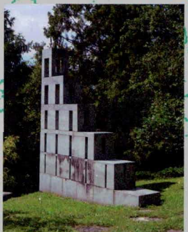
Claus Bury Stufenschichtung , 1994 Bleistift, Pinsel in Tusche auf Papier Erworben mit Mitteln der Lampedusa Stiftung, Vaduz