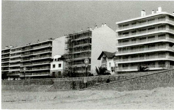
© nikolaus walter, st. jean de luz, frankreich, 2007