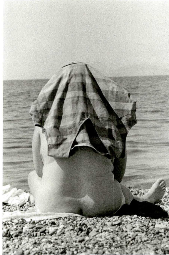
Matala, Kreta, 1985

Nikolaus Walter Fidelisstrasse 17 A- 6800 Feldkirch niwalt@aon.at