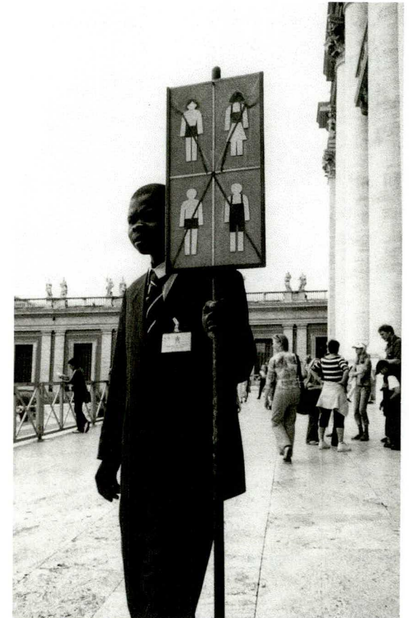
Bekleidungswechsler vor dem Petersdom, Rom, 2004