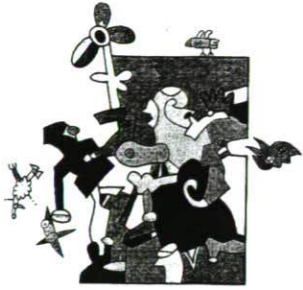
Gutes Flugwetter, 1979 Deckfarben und Farbstifte 39,2×32,1 cm Bez. u. M.: Gutes Flugwetter Otmar Alt 79 LSK 81.05