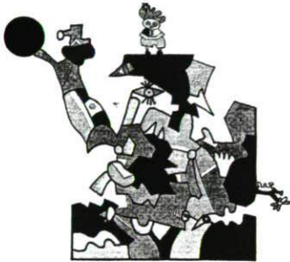
Schwarzwaldwanderung, 1980 Gouache, Deckfarben und Farbstifte 39,1×32 cm Bez. u. M. (Feder in Dunkelbraun): Schwarzwaldwanderung Otmar Alt 80 LSK 81.06