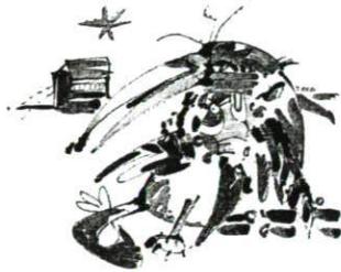
Die Krähe, 1984 Tusche, Acryl, Farbstift, collagiert 39×44,5 cm Bez. o. r. (Feder in Schwarz): O. Alt 84 LSK 89.03