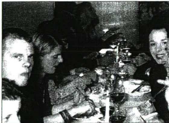
Karls Garage: Essen und Trinken à discretion, wo's sonst nur nach Lackpolitur und Öl riecht.

Die Ausstellung zeigt alle Bilder: Bis 7. Nov. Do/Fr 17-20 Uhr, Sa/So 15-18 Uhr.