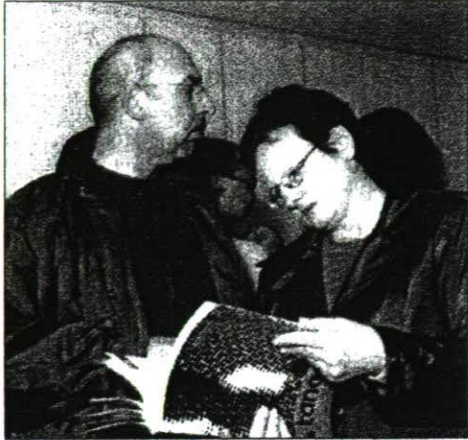
Prüfung der neuen Tangente-Chronik.