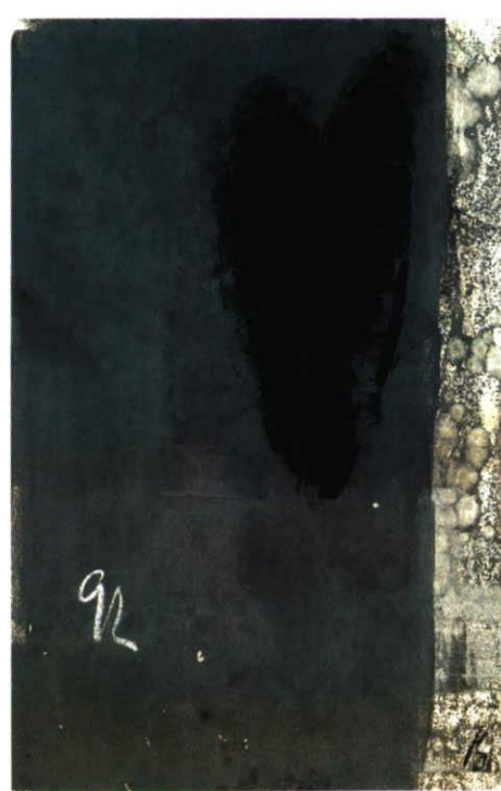
Schwarzes Blatt, Acryl u. Kreide, 62,5 x 44,5 cm, 1992