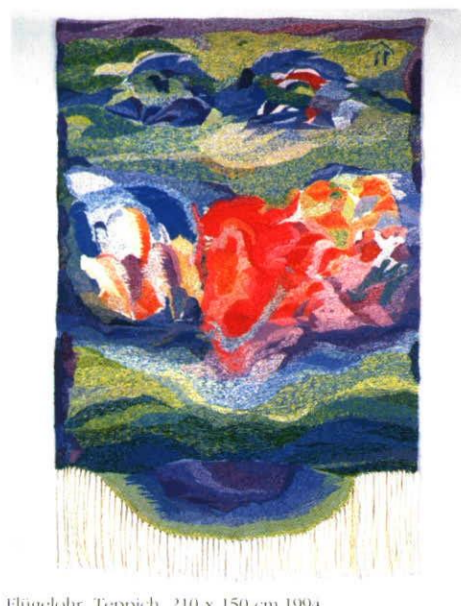
Flügelohr, Teppich, 210 x 150 cm, 1994