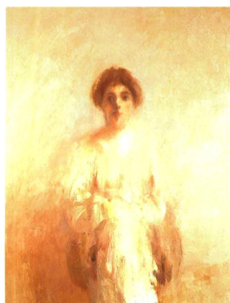
Ingrid, 95 x 70 cm, 1981