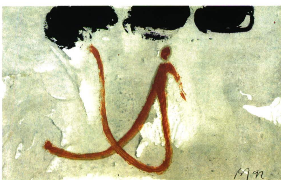
Ohne Titel, Malwasser und Acryl, 40,3 x 59,5 cm, 1992