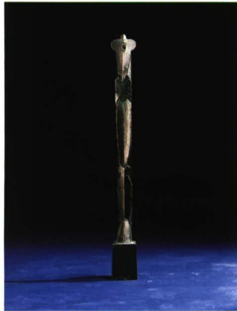
Figur V (Metamorphosenzyklus), Bronzeguss, 70 cm, 1991