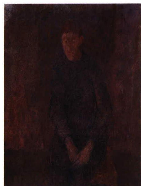
Daniel, Öl/Holz, 51 x 38 cm, 1992