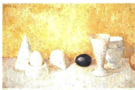
Stilleben auf Gelb, Öl/Leinwand, 34 x 54 cm, 1986