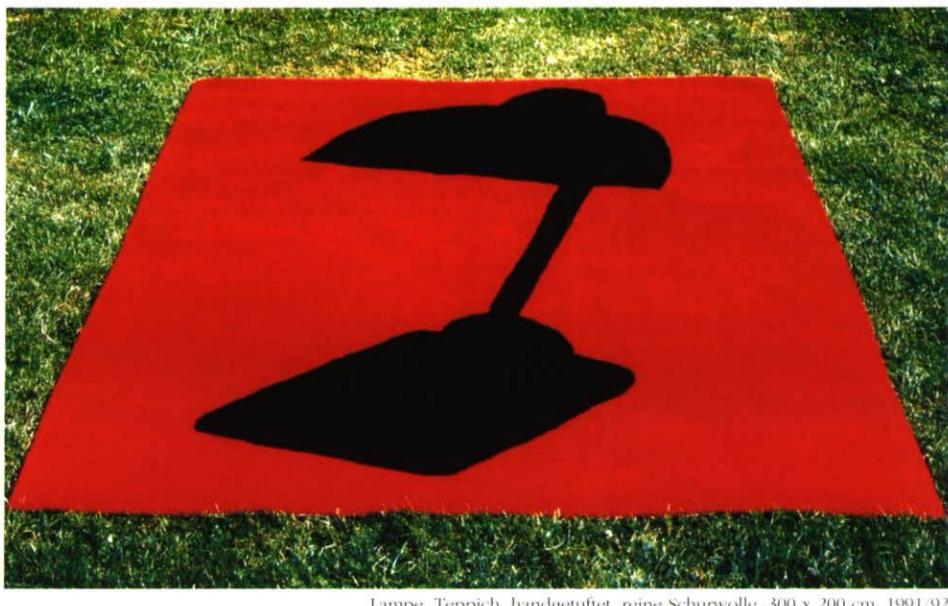
Lampe, Teppich, handgetuftet, reine Schurwolle, 300 x 200 cm, 1991/92