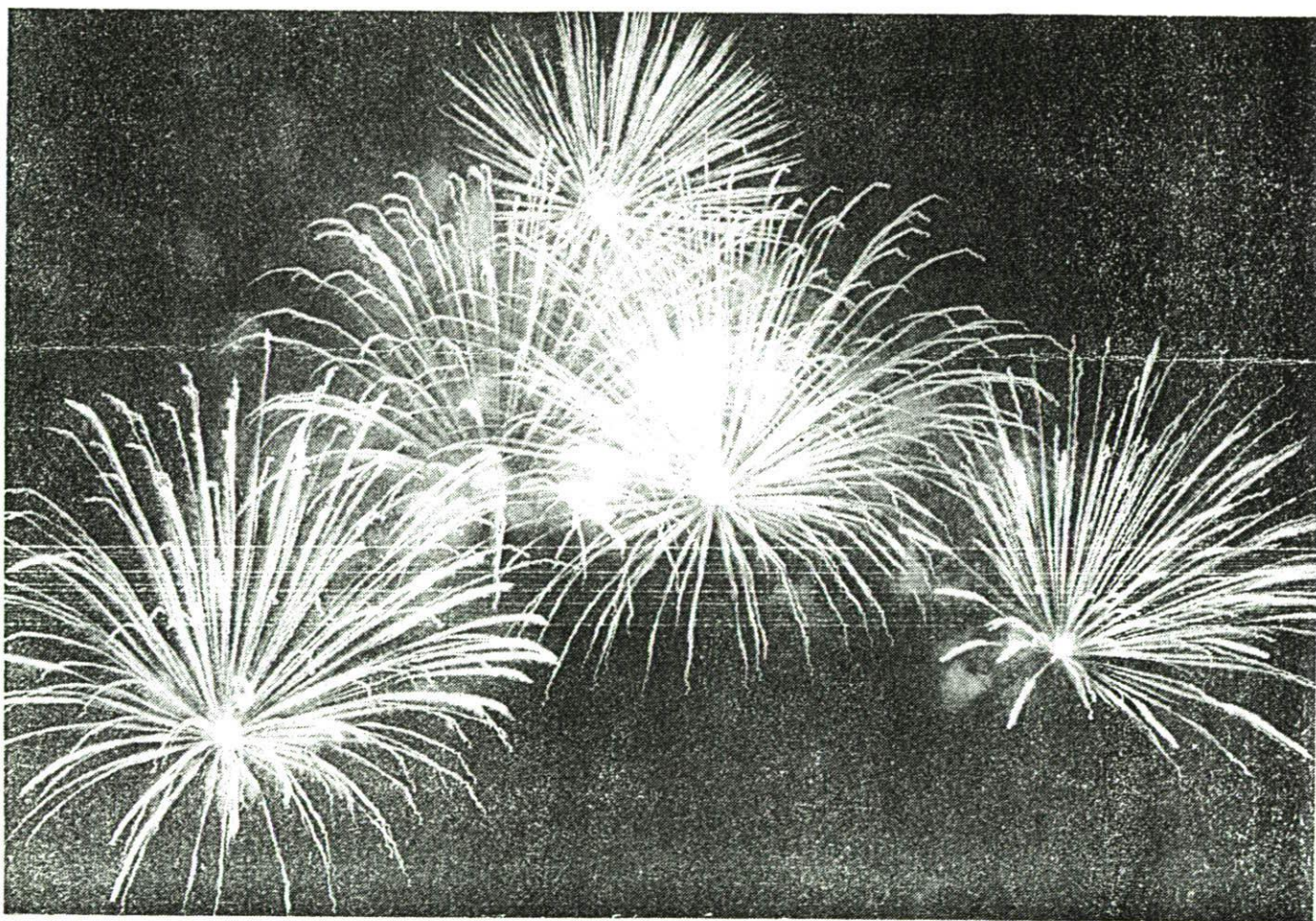
Une figure expressive du feu d'artifice de la Fête nationale 1989 à Vaduz.

S O M M A I R E : Notre 17e voyage: la parole aux participants. Le 150e anniversaire de la naissance de J.-G. Rheinberger célébré aussi en Belgique. Les nouveaux timbres du 4 septembre. Les sportifs de l'été. Notre prochain rendez-vous : l'assemblée générale du samedi 7 octobre prochain à OCQUIER. (A ne pas manquer!)