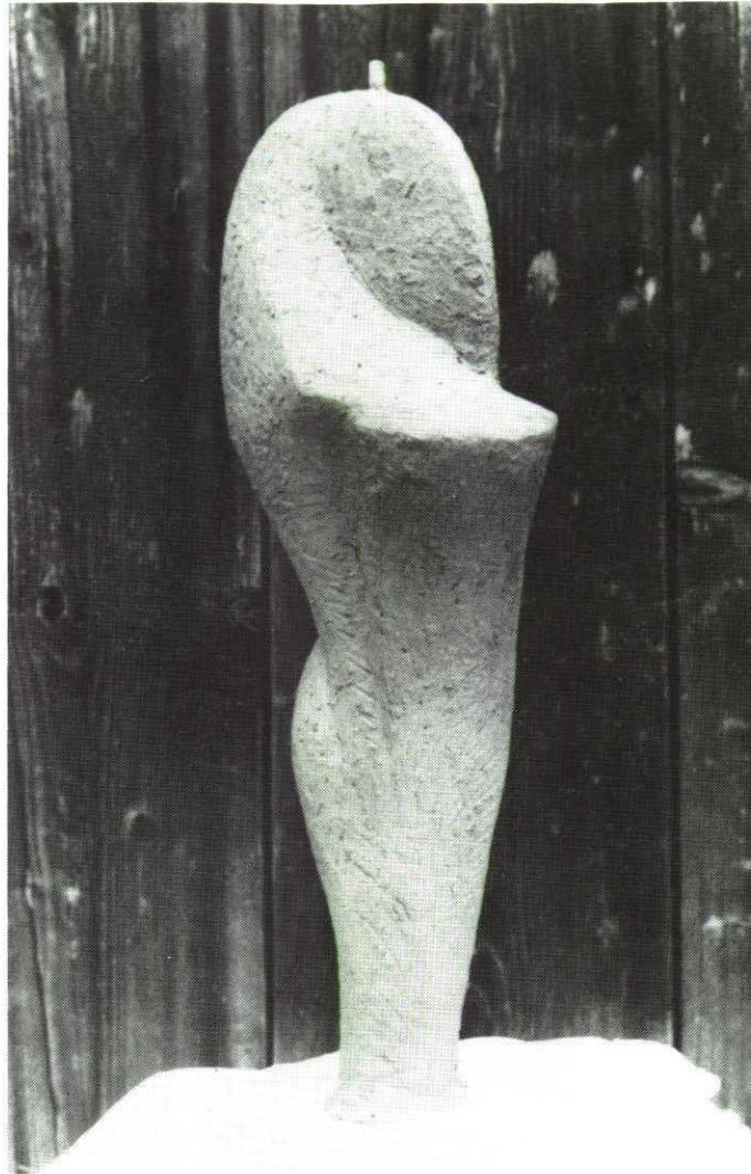
Petra Blum: Sprache im Raum