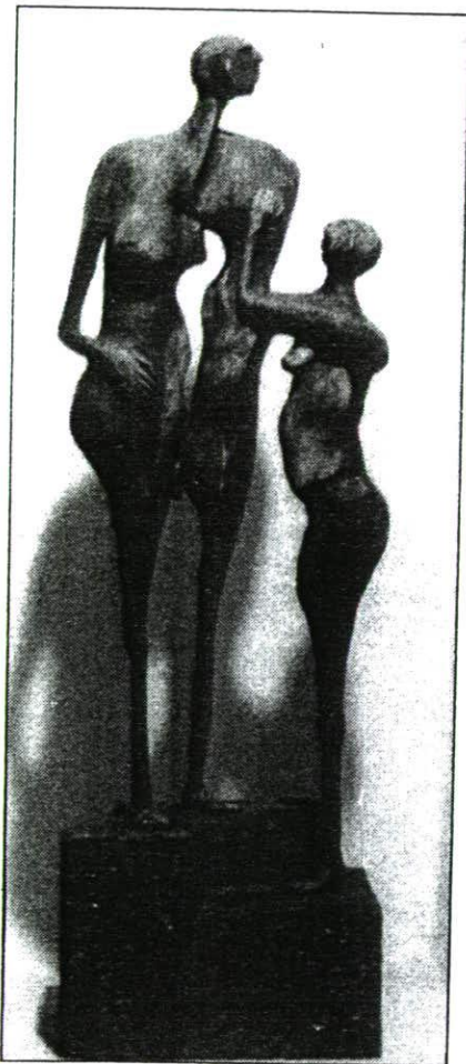
Eine der Skulpturen von Myriam Bargetze.

Im Pfrundhaus in Eschen herrscht dieser Tage Hochbetrieb. Der Eschner Bild-