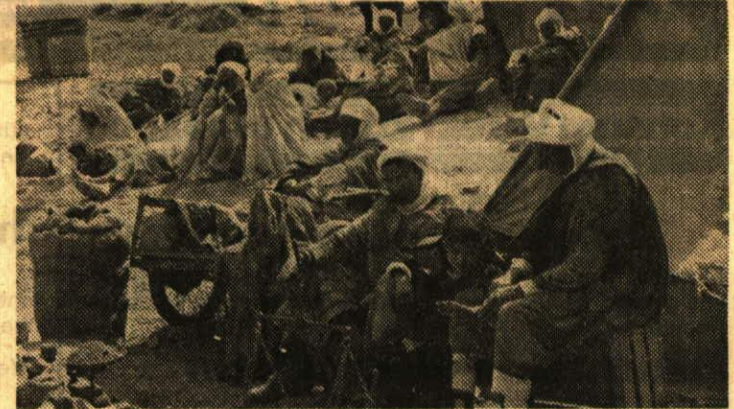
Laghouat, Algerien: «Allah hat die Zeit geschaffen; von Eile hat er nichts gesagt»

Der «Züri Leu» dankt der 3M herzlich für diese splendide Gabe!