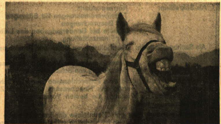
Pitt-Meadows, Kanada: «Da muss ja ein Ross lachen...»