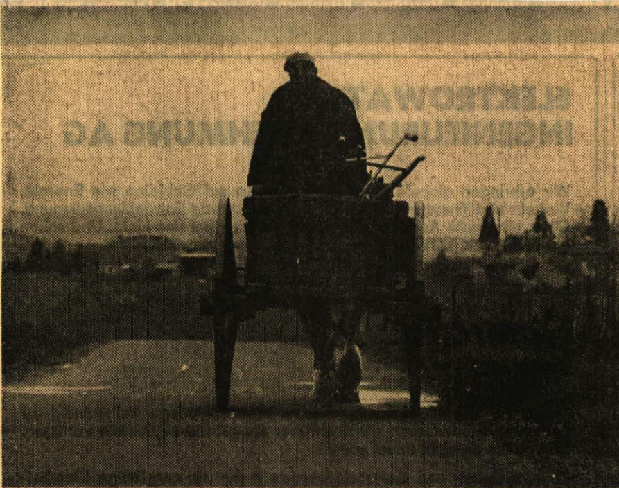
Burgund, Frankreich: «Von der Arbeit in den Reben zurück zum Hof — er ist noch König der Strasse»