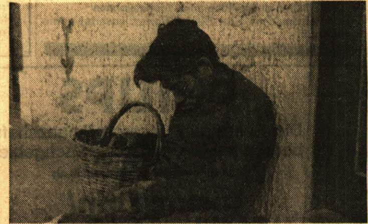
Guayaquil, Ecuador: «Mittagspause»