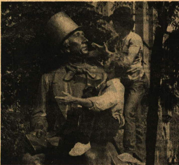
Kopenhagen, Dänemark: «Christian Andersen erzählt Määrli...»