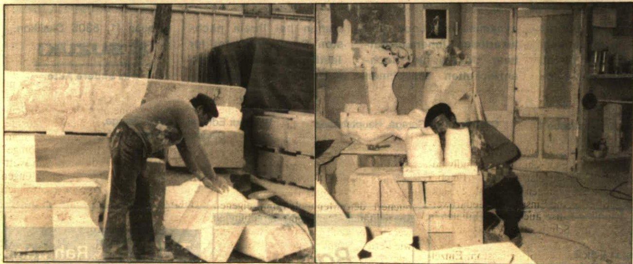
Der Künstler aus Eschen bei seiner Arbeit in Italien.

sen: nämlich in die Werkstatt des Bildhauers. Demzufolge präsentiert sich die Ausstellung im Schulzentrum von Eschen als eine Werkstattgalerie, die dem Besucher viel von der Entstehung der einzelnen Exponate vermittelt. Die Ausstellung ist Montag bis Freitag von 17-20 Uhr, Samstag und Sonntag von 11-18 Uhr, geöffnet.