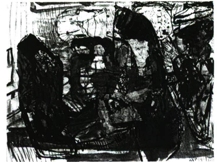
Walter Libuda „Vorbei, mittendrin ...“, Farbstift, Gouache, Graphit, Kreide, Kugelschreiber und Tusche auf Papier, 1992, 50 x 65 cm