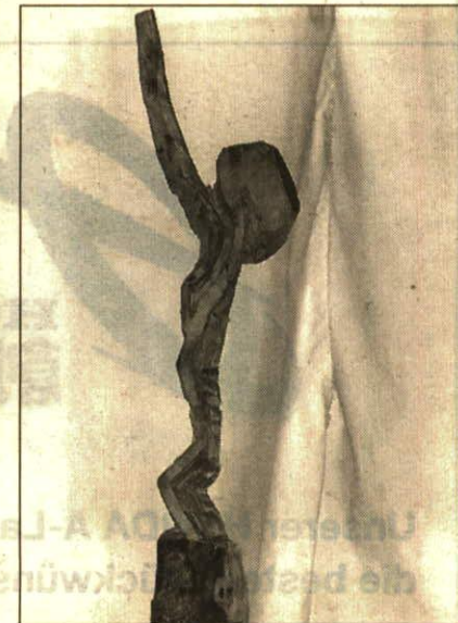
Eine seiner Arbeiten in Holz.

rei und Performances bekannt wurde, bedient sich auch anderer Kunstformen, wie Bildhauerei (Stein, Holz), experimenteller Musik und einigem mehr. In Lindau haben die Besucher die Möglichkeit, neben seinen grossformatigen Bildern auch einen Teil seiner bisher in der Geborgenheit des Ateliers gepflegten, künstlerischen Leidenschaften zu erforschen. Öffnungszeiten der Messe: Samstag, 30. Mai bis Montag, 1. Juni, von 10 bis 21 Uhr.