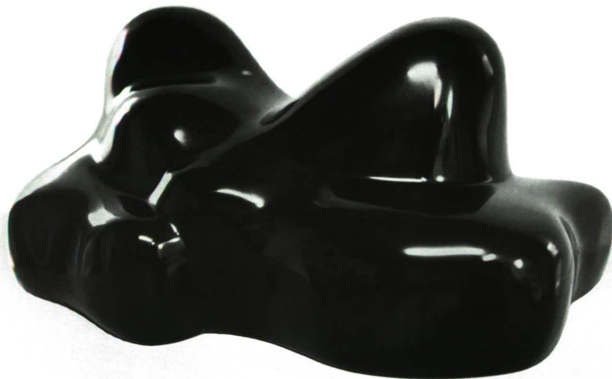
RUHENDE Marmo Statuario 57 x 27 x 24 cm