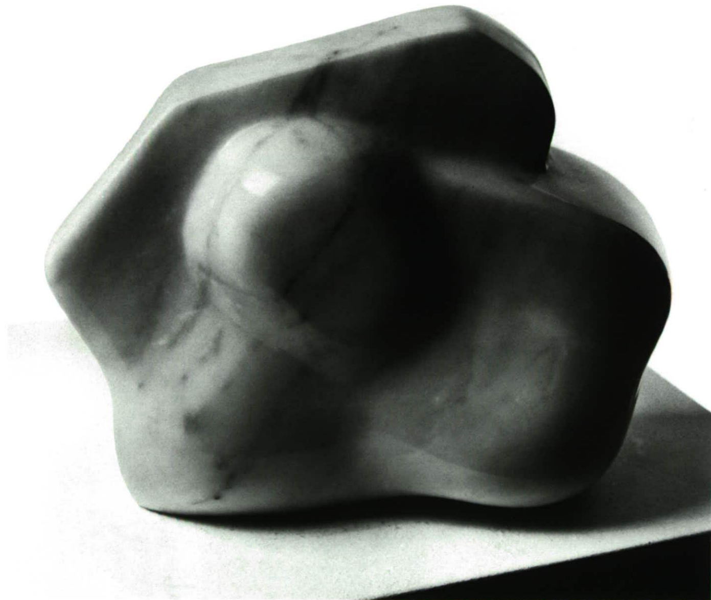
LIEGENDE Marmo Statuario 38 x 20 x 20,5 cm