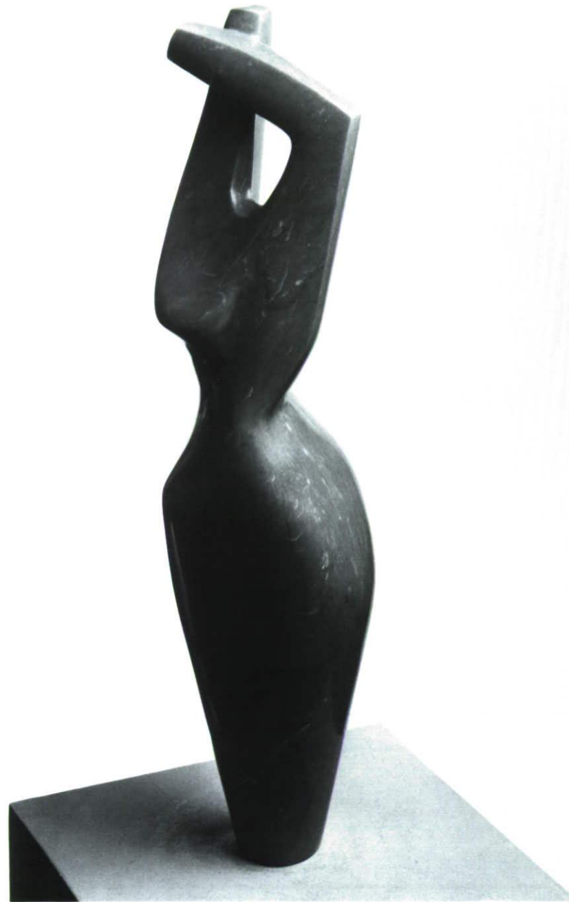
TORSO Marmo Statuario 32 x 22 x 78,5 cm