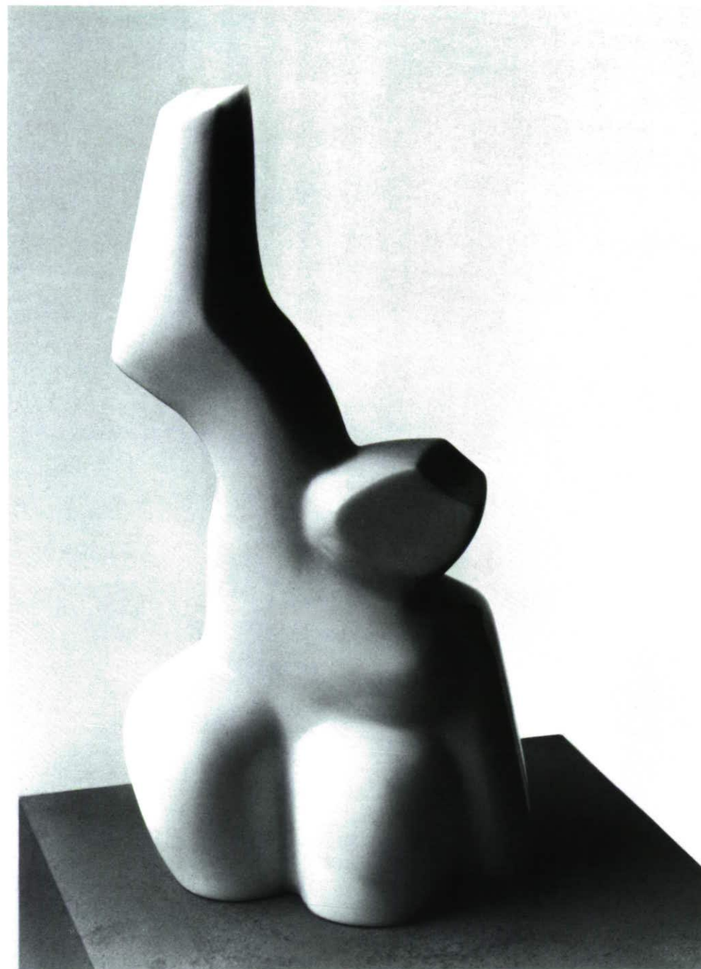
FRAU Marmo Statuario 20 x 20 x 77,5 cm