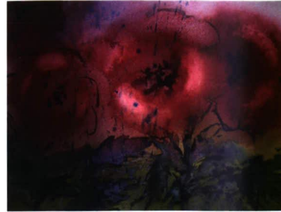
Aquarell, 70 x 50 Preis 980.- CHF (mit Rahmen)