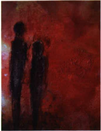
Acryl, 60 x 80 Preis 750.- CHF