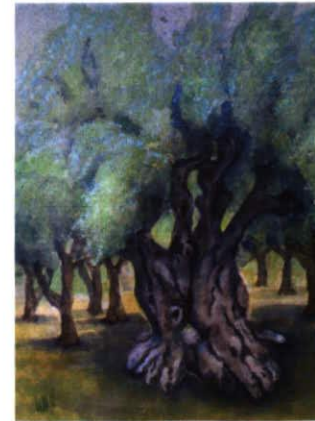
Aquarell, 50 x 70 Preis 780.- CHF (mit Rahmen)