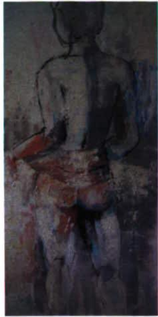
Acryl, 50 x 100 Preis 800.- CHF