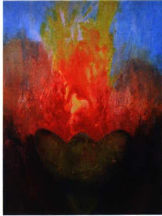
Acryl, 60 x 80 Preis 750.- CHF