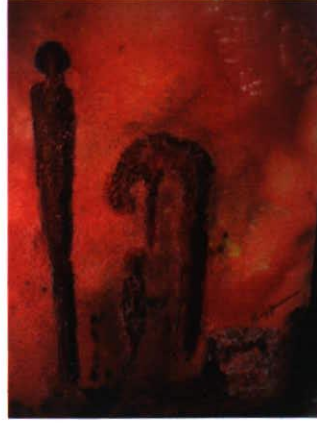
Acryl, 60 x 80 Preis 750.- CHF