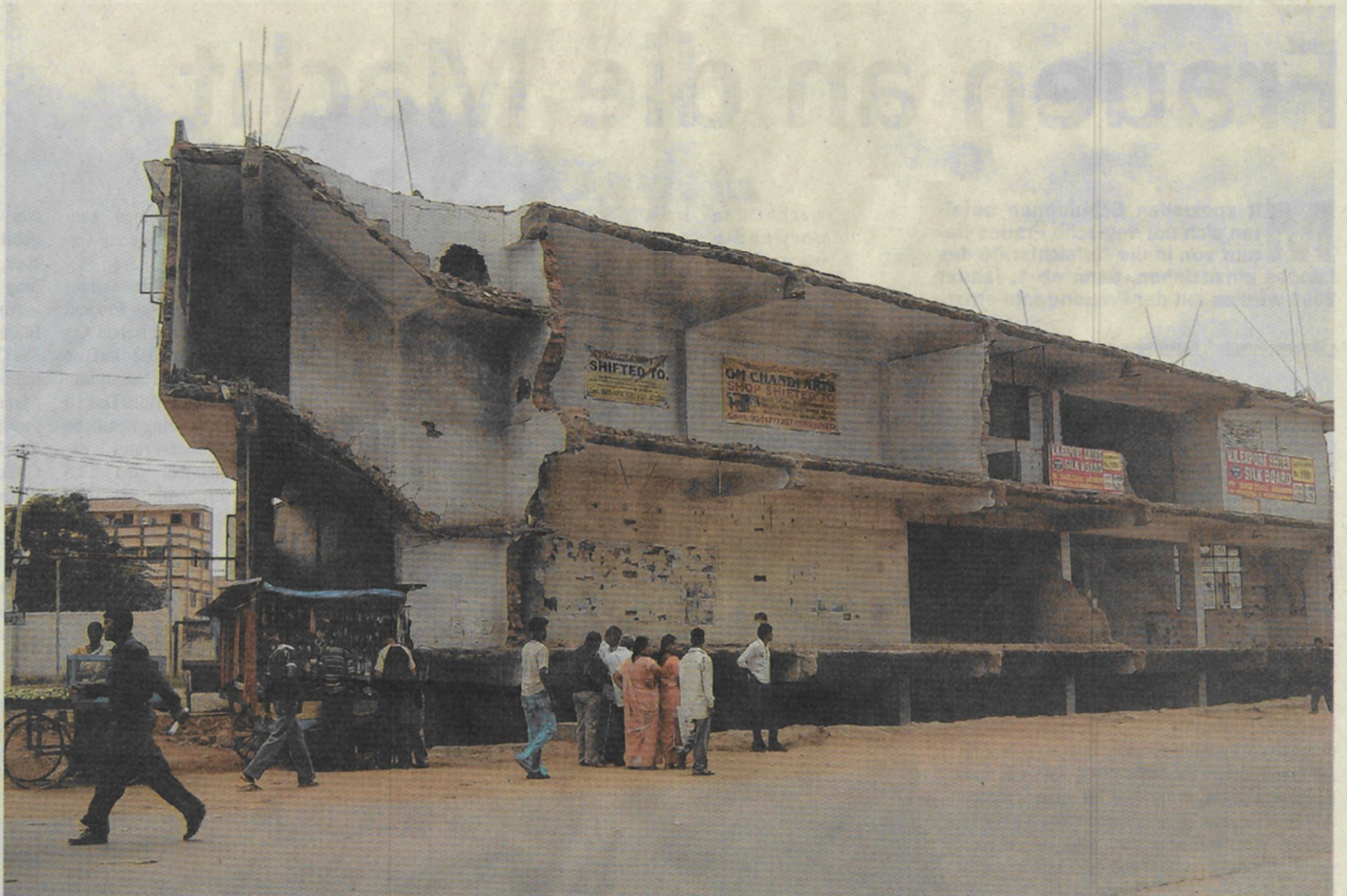
Ganze Häuserzeilen wurden abrasiert. Oft sind die intakten Räume noch bewohnt.

einem Gelände der Firma Keonics eingemietet, die auch alle notwendigen Infrastrukturen und deren Unterhalt überwacht. Davon gibt es eine ganze Menge, angefangen beim grosszügigen Golf Green, bei den verschiedenen Schwimmbädern und Fitnessclubs bis zu luxuriösen Restaurants und Relaxzonen.