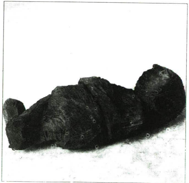
Baby, Buche bemalt.