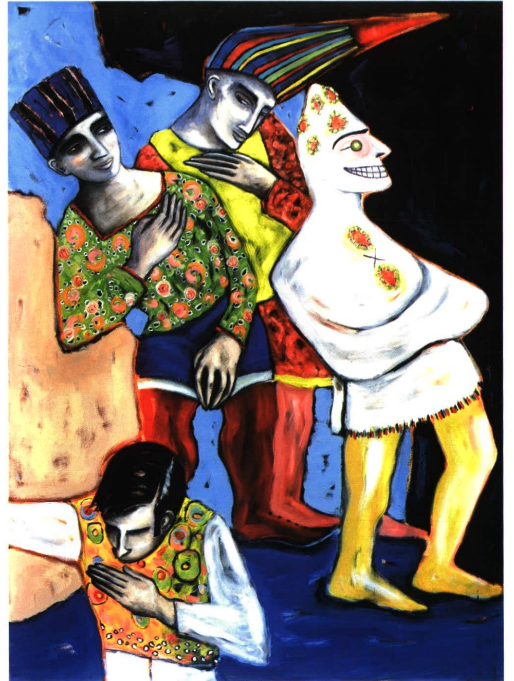
Vier Narren 139 x 194 cm Öl/Leinwand