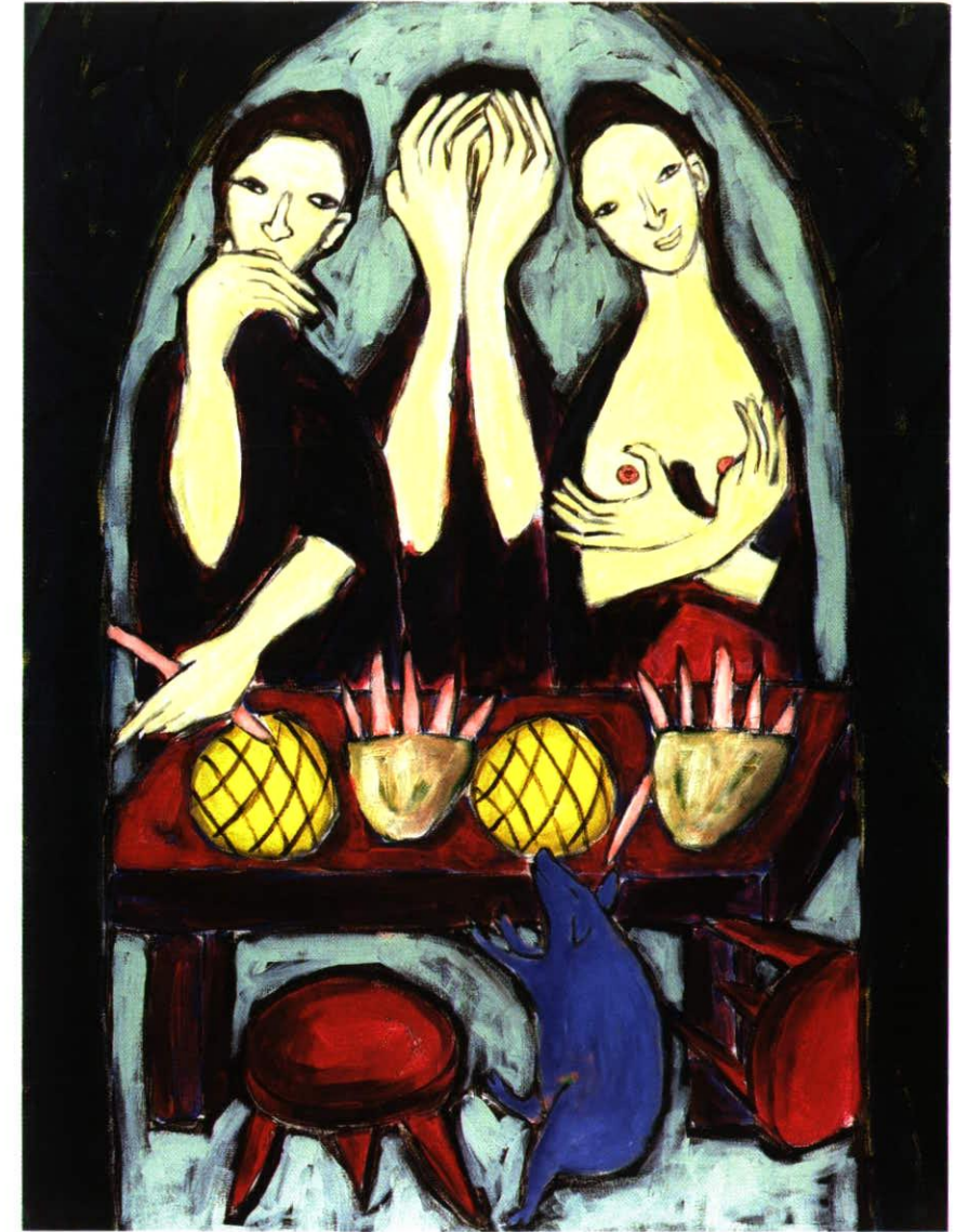
Frau und Sau