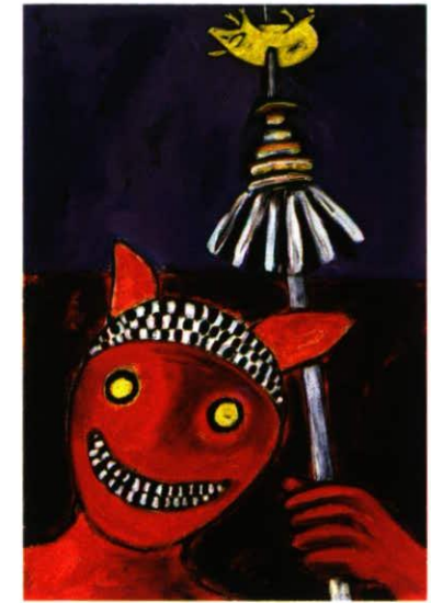
Pujol jagt eine Sau 53 x 78 cm Acryl / Leinwand