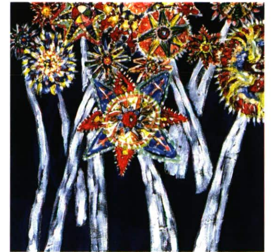
Winterlandschaft 75 x 74 cm