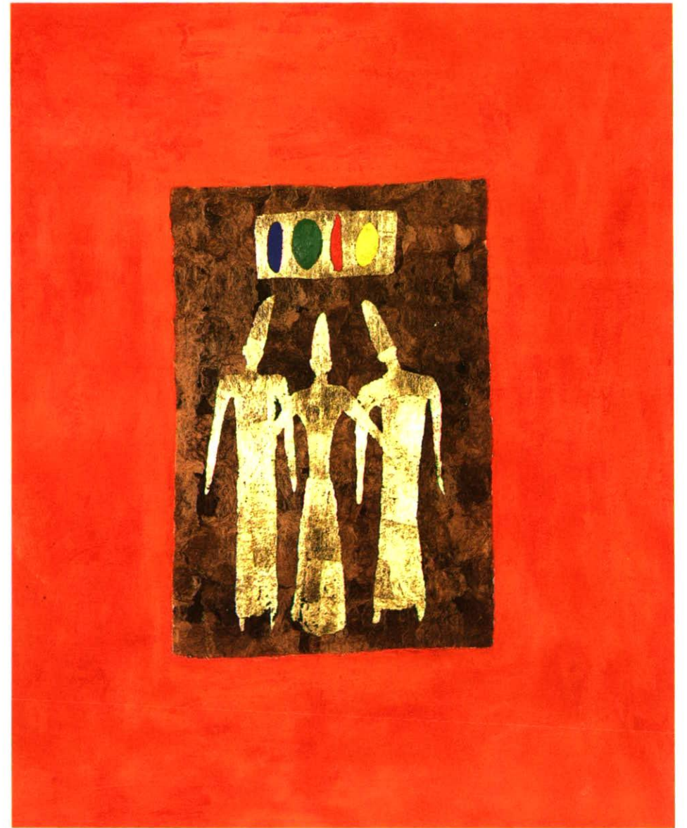
Giganten 100 x 81 cm