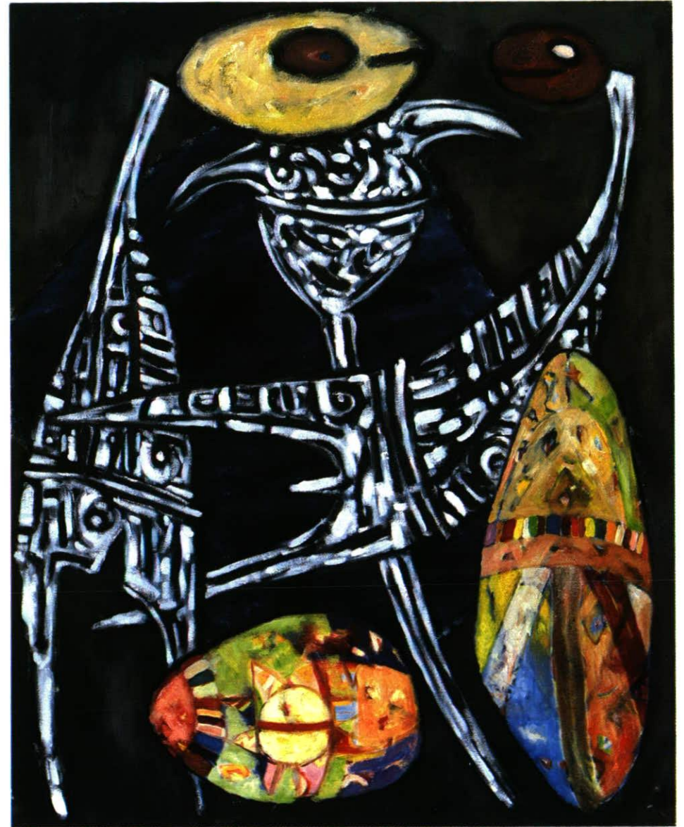
Gretel und Hänsel