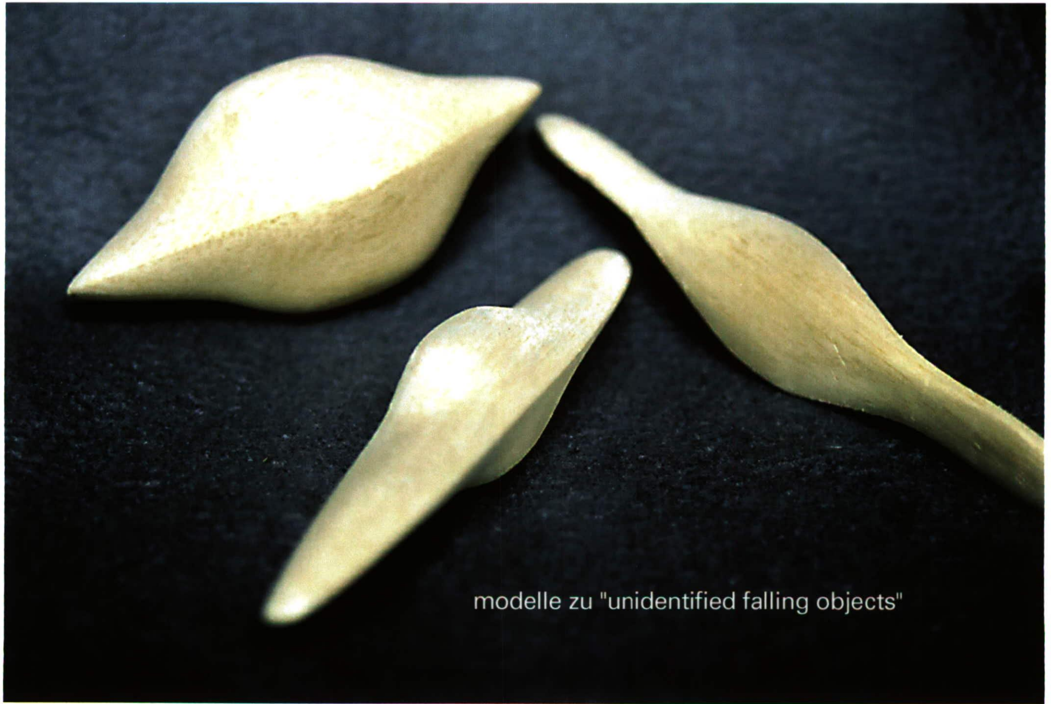
modelle zu "unidentified falling objects"