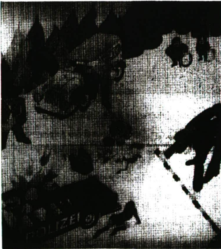
Beim Betrachten der Entwürfe zum Kinderbuch «Buffo-Buffo» kommt erst richtig zum Ausdruck, wieviel Empfindsamkeit, Gefühl und Poesie hinter dem scheinbar rauhen Kern dieses Künstlers steckt. Unsere Aufnahme zeigt einen Verkehrsunfall, der einem Frosch zum Verhängnis wurde.

Diese Dinge geben mir zu denken. Wahrscheinlich auch Ihnen. Und wenn es so ist, glaube ich, werden Sie meine Bilder bestimmt verstehen.»