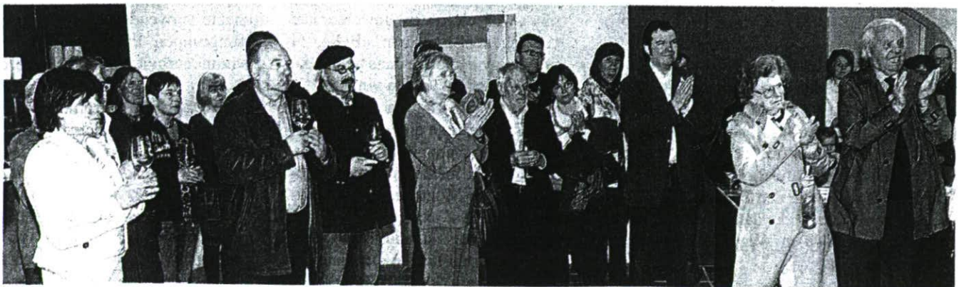
Zahlreiche Interessierte waren in Nendeln bei der Präsentation des 22. Liechtensteiner Jahres-Eies vor Ort.