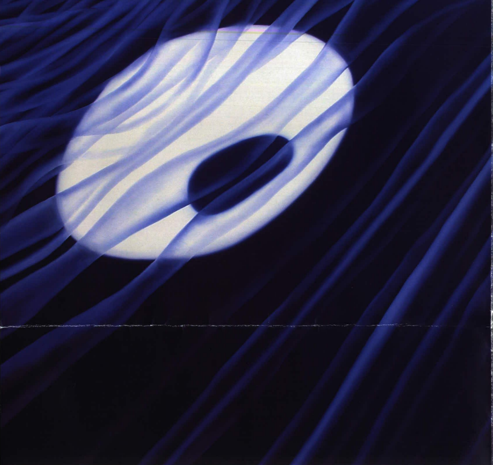
„blauer Buddha auf Tauchfahrt“ 2005 140 x 140 cm Öl auf Baumwolle