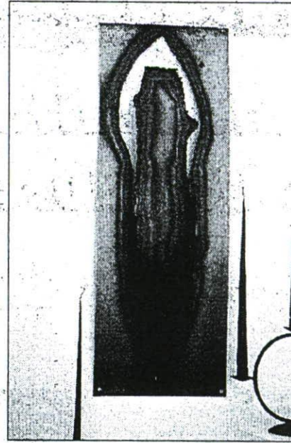
Eine der Arbeiten von Silvio Büchel.

«Aids - Immunschwäche-Krankheit des Systems» nennt Patrick Kaufmann dieses Bild (Öl-Acryl auf Leinwand) im Format 99x99 cm.