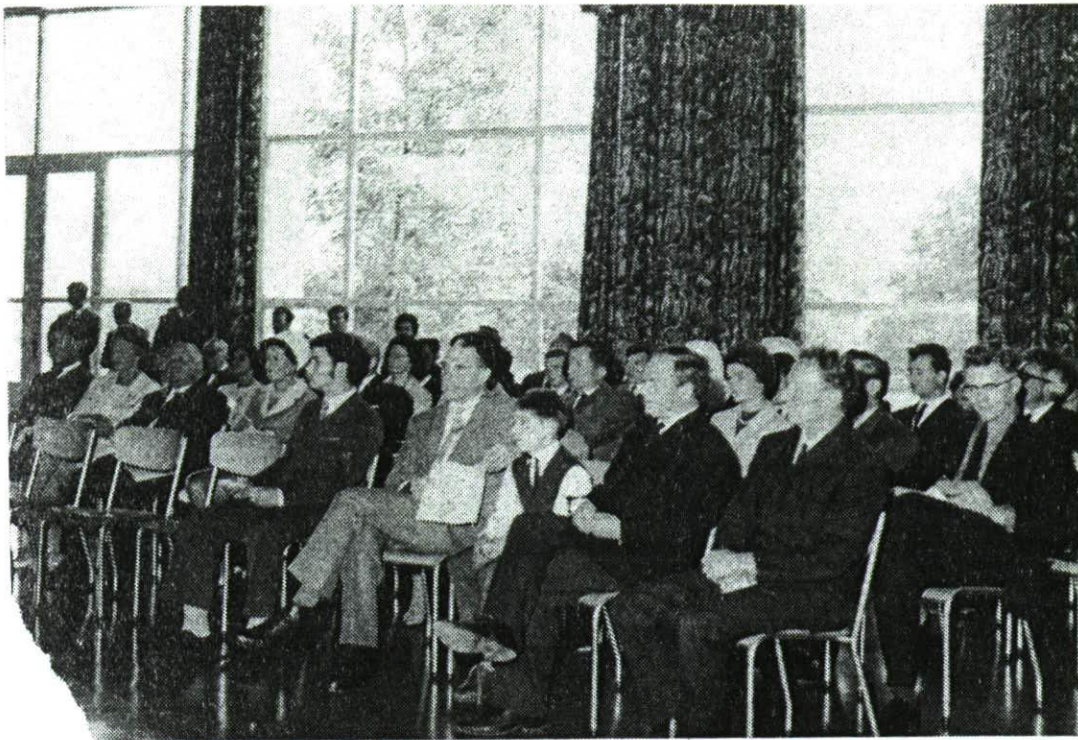
Die illustre Gäste und Kunstfreunde aus Liechtenstein hatten sich zur Vernissage versammelt.

genommen wurden, bringen wir die Einleitung: